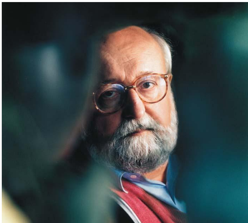
Krzysztof Penderecki